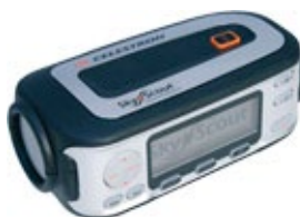
Lån fx dragter og sverd til rollespil... eller den elektroniske stjerneikkert SkyScout...

Du bestiller materialer gennem din praktiklærer. Vi leverer materialerne til din praktikskole.